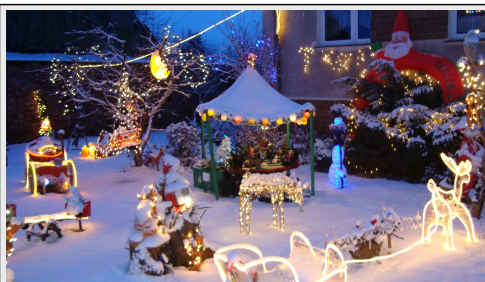
Przed swoim domem przy ul. Szerokiej 32A (w głębi podwórka) pan Wojtek tworzy bajeczną Mikołajową krainę. Tysiące lampek, dziesiątki postaci przyciągają setki dzieci (i nie tylko)

Zapraszamy do odwiedzin tej bajecznej krainy przy ul. Szerokiej 32A - jak do niej dotrzeć można zobaczyć na stronie internetowej www.wojtekb.szczecin.pl .