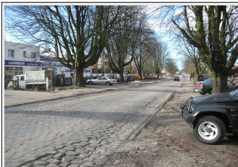
Zgodnie z zapewnieniami, przebudowa ul. Łukasińskiego powinna rozpocząć się na początku kwietnia 2012 r.

Przypomnijmy, że w zakres prac tej, długo wyczekiwanej inwestycji, wchodzi m.in. wykonanie ronda przy ul. Topolowej o średnicy zewnętrznej 30 m, wykonanie ścieżki rowerowej dwukierunkowej po stronie północnej, wykonanie chodnika, oświetlenia ulicznego, wymia-